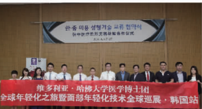
维多利亚·哈佛大学医学博士团 全球年轻化之旅暨面部年轻化技术全球巡展·韩国站