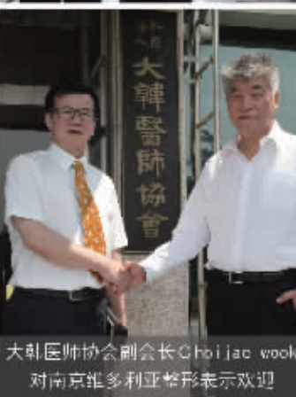
大韩医师协会副会长 Choi Jae wook 对南京维多利亚整形表示欢迎