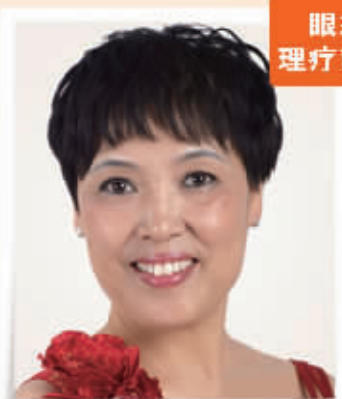
丹凤眼首位体验者