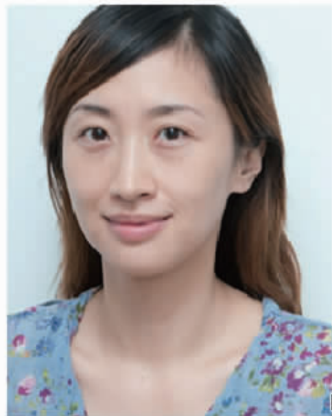
眼袋不见了：你还能猜出我几岁？

眼魔师推“特惠”：360元5日3次祛眼袋眼纹，另加赠价值460元的美眼贴一套（每天仅限15名）！