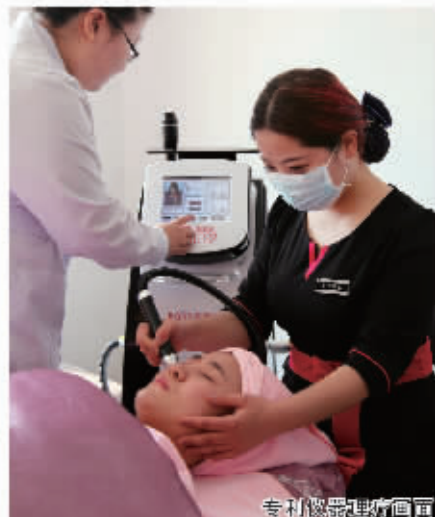
专业仪器治疗画面