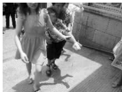
家人抱着军军从救护车上下来焦急万分

“根据初步检查,孩子在喝下洗洁剂后出现了咽痛、呕吐的症状,咽喉部位有明显的灼伤。从吐血症状看来,孩子的消化道黏膜也一定有部分灼伤。由于不确定孩子到底喝下去多少,所以暂时还不能确定灼伤的程度。从尿血的情况来看,还有可能存在其他方面的伤害,要先验尿。”急诊室医生