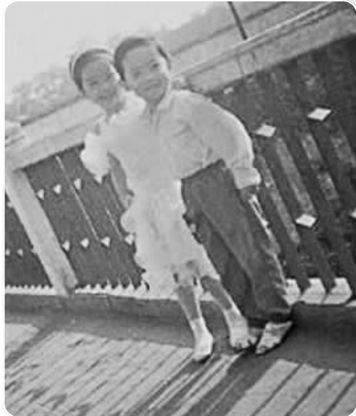
6岁那年分别前,两人留下合影