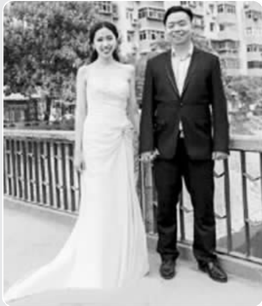
在过去合影的地方,两人拍了婚纱照

不久前,在曾留下合影的桥边,他们再次拍下了一张合影。这次,是婚纱照。这样的浪漫故事,就发生在郑州。你羡慕他们的爱情吗?年幼时你说要娶的那个女孩,如今又去哪儿了?