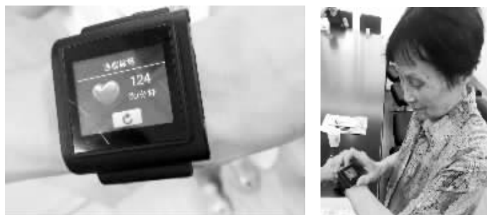
戴上这个智能腕表,老人随时能监测脉搏,心率异常还会自动发出警报

“南京绝大多数老人还是要居家养老的,所以我们正在借助现代化信息手段为老年人提供服务,比如打造12349养老服务热线平台,推广具有紧急救援、自动报警等功能的养老服务信息呼叫终端。”南京市居家社区养老服务协会有关负责人向记者介绍,这款智能腕表,具有脉搏监测、一键呼救、GPS定位、用药提醒等多项功能。“首先它是一部生命监测仪,老人只要正常开机佩戴,12349养老服务信息平台就能24小时监测老人脉搏、心率等生命体征。儿女只要下载个软