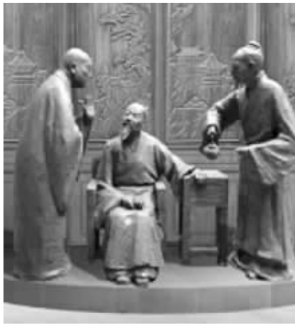
效果图 规划方案截图