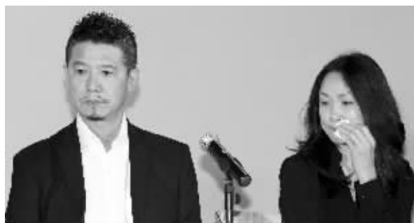
柯爸全程表情严肃,柯妈不时偷偷抹泪

陋的伤疤”:“我知道这件事情就像一个丑陋的疤一样,会在我身上一辈子,但它在在我身上,我可以随时看到它,记得犯错的痛苦。所以,请大家还有所有认识我的人和我认识的人,都不要做任何违法的事情,我会努力传递正能量给大家,我会努力让自己更好,还有机会传递正面的能量、正面的讯息给大家。对不起大家,对不起所有的人,我做了最坏、最不良的示范。为了这些人,我会很勇敢,让自己越来越好。对不起!谢谢大家!”