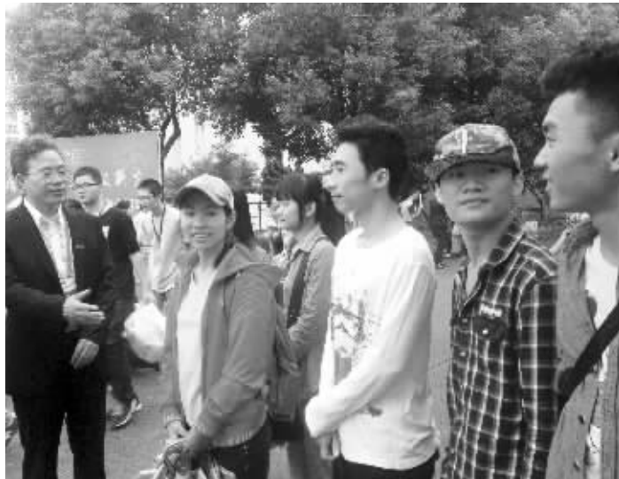
33名海南新生组团报到,学校老师欢迎新生

“亲爱的小鲜肉们,欢迎加入我们的英雄联盟……”李子越是常州大学化工专业的一名大四学生,为