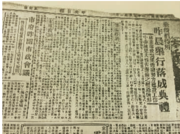
1931年5月21日《中央日报》刊登了华侨招待所落成的消息