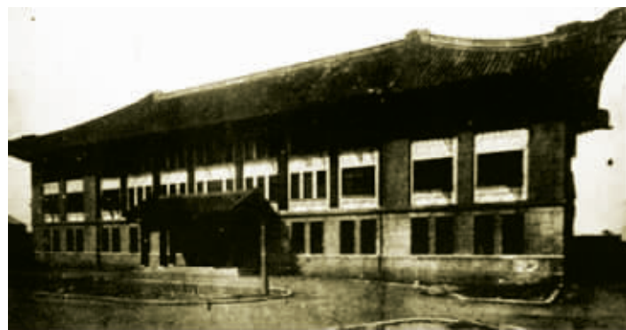
位于中山北路的华侨招待所,现为江苏议事园

南京解放后,华侨招待所先后作为江苏省招待所、江苏省人大常委会办公楼,现在是名为“江苏议事园”的宾馆。