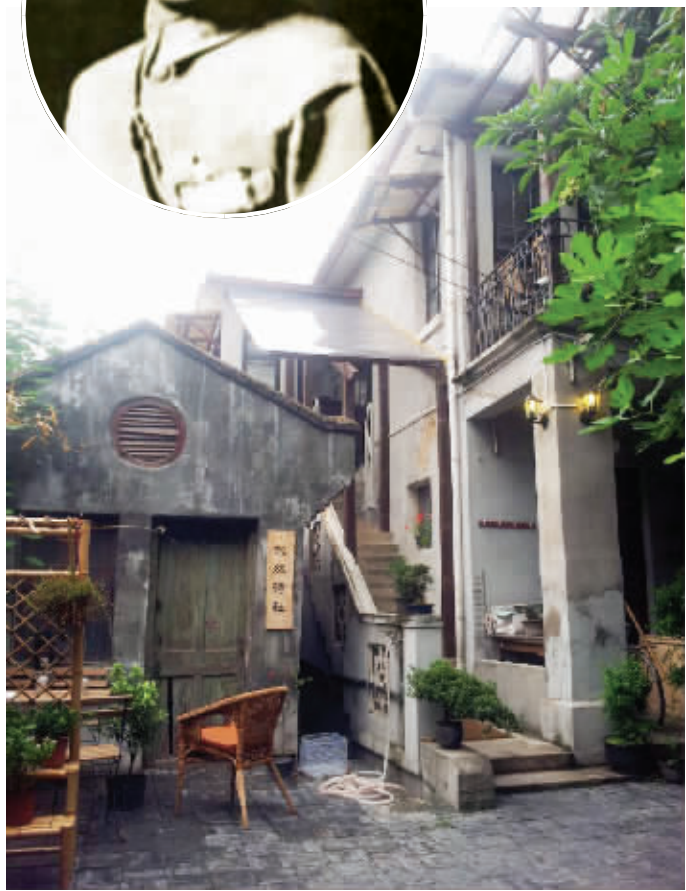
位于秣陵路21号的刘峙旧居