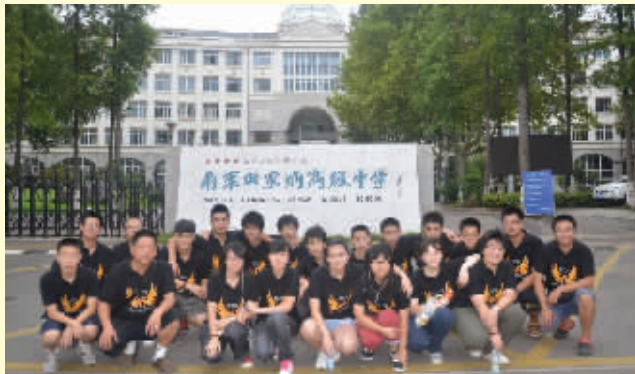
学校航模队多年雄踞江苏省航模比赛团体冠军

辛勤耕耘换来累累硕果。2012—2015年,中日班学子参加江苏省学业水平考试通过率均为100%;零起点日语水平初中生经过三年学习,100%进入日本本科院校;2014年参加日本留学生考试的17名学子中,14名学子获得通往亚洲百强名校的通行证;近两届中日班毕业学子中,9人因成绩优异获得日本政府颁发的留学生奖学金,每人奖金576000日元,获奖比例高居同类学校之首;在日本大学举办的高中生日语演讲比赛中,多次获得最高奖项,至今已成功实现“五连冠”。