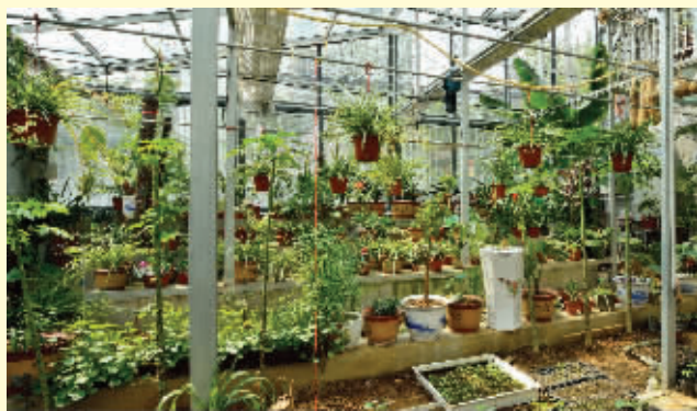
深受学生喜爱的创新实验基地