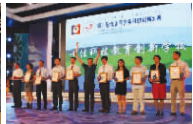
南京田家炳高级中学获全国科技教育创新十佳学校