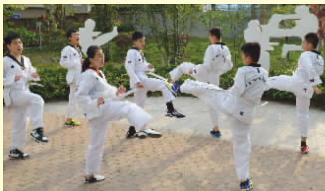
跆拳道队常揽各项比赛冠军