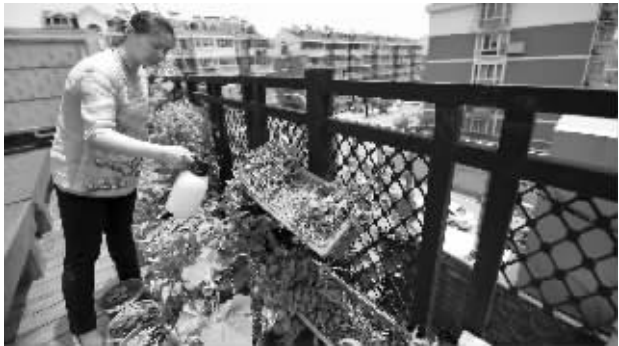
社区工作人员在天台上打理