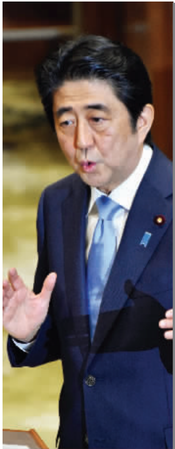
5月20日在日本东京，日本首相安倍晋三参加日本国会的党首辩论

1945年7月26日，中美英三国在柏林西南的波茨坦发表敦促日本投降的《波茨坦公告》，公告还敦促日本履行中美英三国于1943年12月发表的《开罗宣言》。《波茨坦公告》和《开罗宣言》是构成战后国际秩序的重要基础文件。