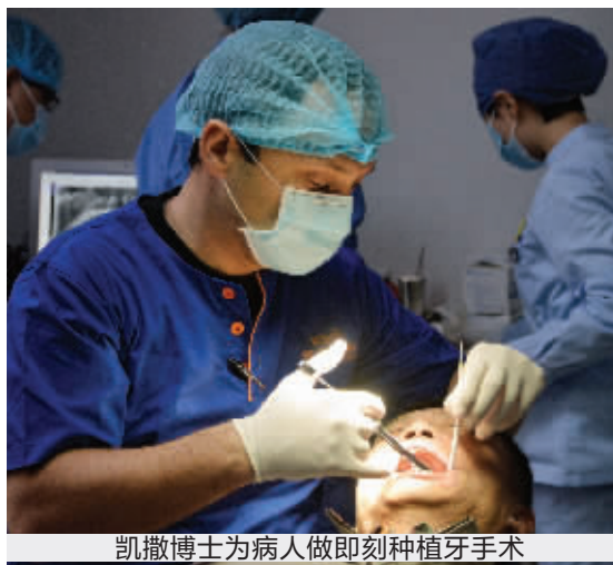
凯撒博士为病人做即刻种植牙手术