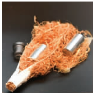
用于偷录的香烟卷