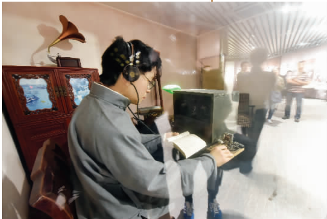
江苏国安教育馆将展出一批谍报设备和情报人员深入虎穴的事迹

而对马东这样的国安人员,需要因为工作而放弃感情的,在国安人员中真实存在,甚至因为保密需要,他们的真实身份连家人都不知道。对他们来说,需要于无声处听惊雷,于无形处建奇功。