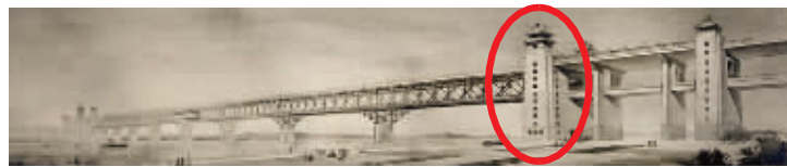
亭楼桥头堡设计图