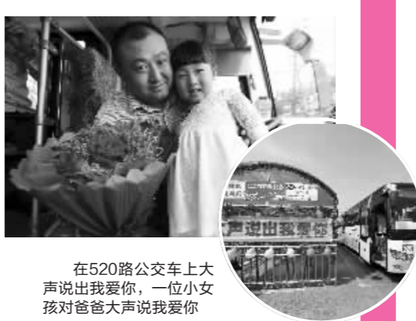
在520路公交车上大声说出我爱你,一位小女孩对爸爸大声说我爱你

520路公交是扬子公交六合公司汽车一队去年开通的线路,由于线路名特别有爱,年轻的情侣们常常是排着队来坐车。昨天的520路公交也充满了浪漫与爱意,不少乘客和驾驶员在这里手捧玫瑰,大声向自己的爱人表白。