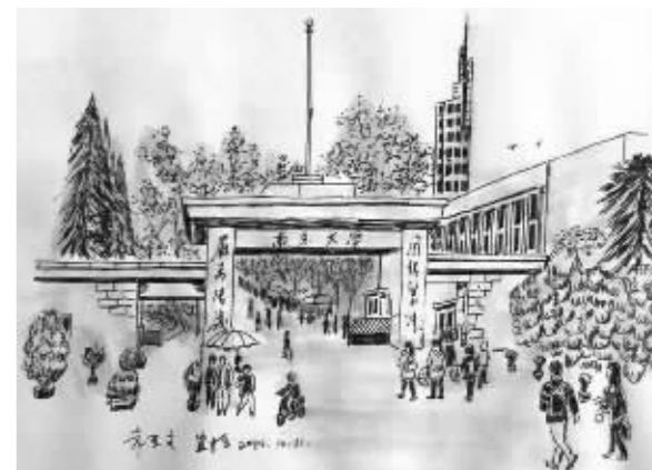
南大鼓楼校区汉口路校门