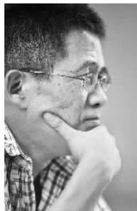
中山大学博雅学院院长甘阳