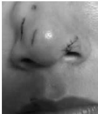
被咬女游客的鼻子