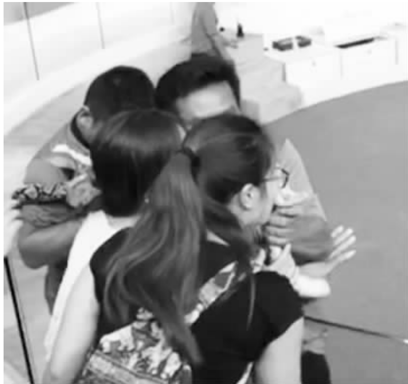
被咬瞬间(视频截图)