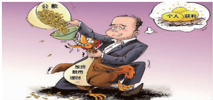
●●● 画话 借“鸡”生财 “新华视点”记者调查发现,近年来,一些地方出现官员、财务人员挪用财政资金等公款,用于炒股、放贷和购买银行理财产品。新华社发 曹一 作

年出不来审计报告,只能说明当地的行政效率低下甚至行政不作为,毕竟在事关儿童成长的大事面前,任何理由都不应该成为绊脚石,当地更不该只顾着台前说大话,背后却无动静。 知名评论人王琳则称:也正因为政府在信息公开的践行上充满了不确定性,公民的申请公开才更彰显其意义。当公民的依法申请还促成了信息公开,司法救济就成了制度管道内最后的权利保障利器。愿饥饿、欺凌和冷漠远离毕节,远离中国。也希望司法能为中国步履维艰的政府信息公开开个套。 不必讳言,当初设立“留守儿童关爱基金”是一种应对“万夫指”的急就章。宣告成立“留守儿童关爱基金”给当地加了分,赢得了舆论的谅解。如果“基金”项目并没有落实,就算当地做了很多“关爱”工作,那也是食言。这和懂不懂行没有关系。