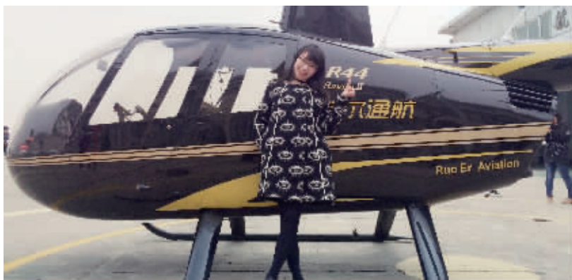
和直升机拍个合影

简单安检完毕。试飞完毕。直升机半停,螺旋桨不停地转动,我们爬进左右机舱,系好安全带,飞行开始!