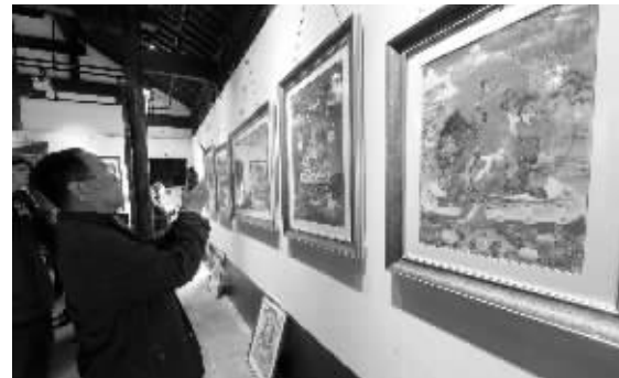
游客在愚园欣赏唐卡艺术

快报讯(通讯员 孙乐 记者 余乐)今年五一,晚清时期南京最大的私家园林愚园开门迎客,目前已吸引了3万多游客前往游览。昨天,愚园举办了西藏国家级非物质文化遗产唐卡艺术作品展。独特的雪域风情,吸引了4000名游客涌入愚园,让市民在家门口便能欣赏到藏族“百科全书”。