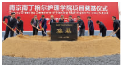
南京南丁格尔护理学院(南京卫生学校江北校区)奠基