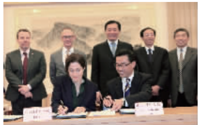
南京卫生学校和英国伦敦国王学院在南京市政府签署合作协议

2016年4月15日与日本高井医院签署协议。学生完成南京卫生学校5年的学习后, 获取国内护士执业资格证, 日语水平达到一级, 可赴日本参加日本护士执业资格证考试, 获证后即可在日本高井医院就业。