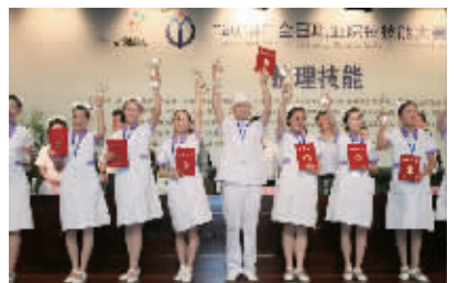
连续获得四届全国技能大赛护理赛项金牌