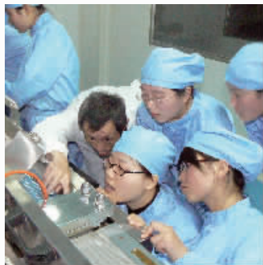
药物制剂综合实训