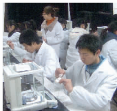
技能实训:药品质量检测