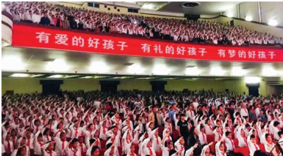
昨天,五老村小学红领巾电影队课上,两千多名师生齐聚一堂,欢庆六一