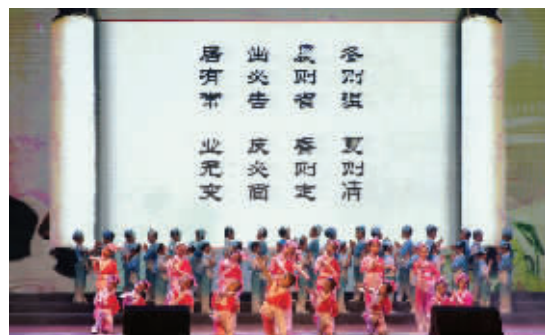
一个半小时的特别队课,节目精彩纷呈