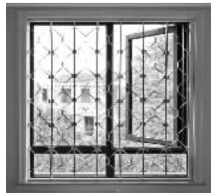
▲防盗窗的室内拍摄图

现快报电商特推出目前市面上具有先进技术的新型折叠防盗窗,这款新型折叠防盗窗是具有国家发明专利产品(专利号:ZL02110917.6),设计新颖、独特,制作工艺精良,外观典雅超凡,内置安装,自由开启,视线毫无遮挡。防盗、护童、消防、方便性能高。