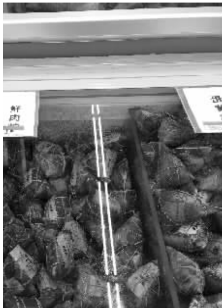
冰柜里散称的鲜肉粽和蛋黄粽

桃园居社区“老来俏舞蹈队”、社区合唱团等文艺团体,将为大家带来歌舞表演。我们还准备了端午习俗有奖问答,同时,还联系了磨刀、修伞、修自行车等的老艺人,提供免费便民服务。“微爱桃园编织社”志愿者也将来到现场,义卖手工饰品,帮助听力有障碍的双胞胎姐妹。