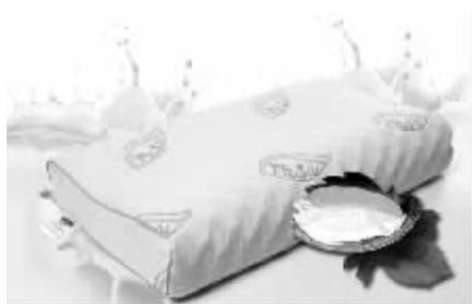
均配有可拆洗枕套(枕套如上图)

枕头是我们睡觉时最密切的伙伴,但是这个伙伴如果不妥,比如太高、太低、太硬、太软或者弹性过强,都会影响我们的睡眠质量。