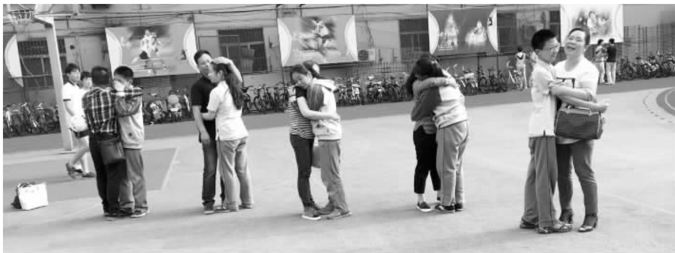
5月30日下午,南京十二中学的学生在参加完问卷调查后,与家长拥抱