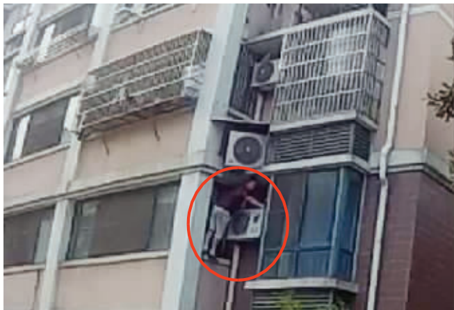
“攀楼哥”正沿着墙角往上爬

快速爬上6楼,另一位同事则在楼下准备应急措施。从楼底下往上看,小女孩趴在阳台窗户上,哭喊着要找妈妈,半个身子已经探出窗外,一只小脚还不时地想往窗台上爬。楼下的围观大人们赶忙劝小女孩不要哭,安慰她说已经在找人救她了。