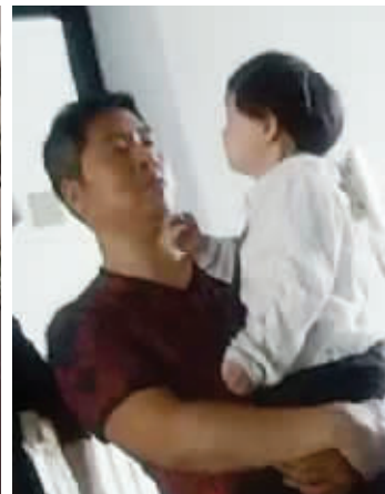
“攀楼哥”在安慰孩子