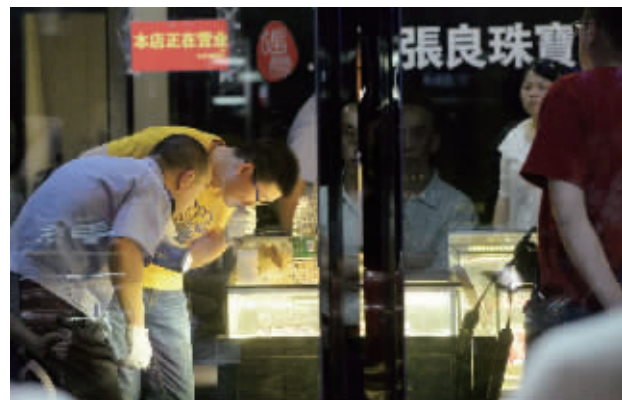
案发后,警方赶到现场勘查

快报讯(记者 刘静妍 陶维洲 通讯员 秦公轩)昨天晚上7点半左右,南京闹市区游府西街上一家金店被抢。截至发稿时,现代快报记者获悉,昨晚11点,嫌疑人在太平南路附近一超市被警方抓获。