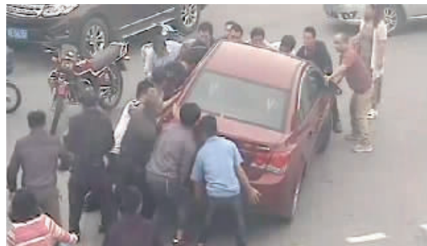
十多路人抬车救人 视频截图

快报讯(记者 韩小强 通讯员 郭昂)日前,一段众人抬车的视频在网上热传。昨天,现代快报记者采访获悉,视频上感人的一幕发生在6月7日上午,地点在苏州工业园区一个十字路口。当时,一名男子过马路被一辆左拐的私家车撞倒,卷进车底,无法动弹。危急时刻,10多名过往路人伸出援手,合力抬起轿车,将男子救出。