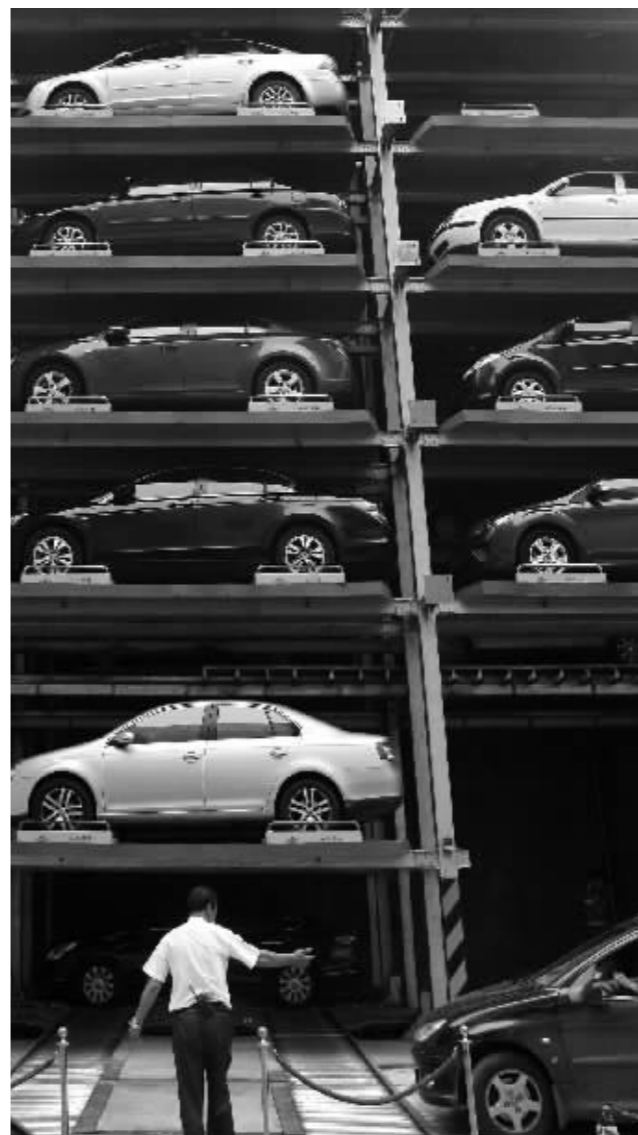
南京一家酒店里的立体车库

立体车库建设时间早、设备维护成本高;停车位大小受限,很多稍大的轿车停不进来;路口太窄不方便开车进来……洪武路立体停车场的万主管表示,很多原因导致他们车库上座率不高。“车库是2000年建成的,SUV停车位只有20个,但目前至少要有50个以上才够用。”万主管告诉现代快报记者,很多宝马车因为超过停车位设计大小或超过承重,都停不进来。此外,跟路边有车位就可