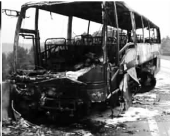
大巴车撞护栏后起火,烧成空架子