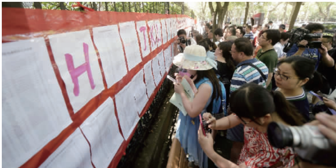
昨天,2720名学生被摇中,将参加南京外国语学校英语能力测试