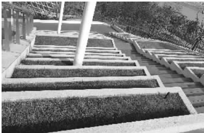
阶梯式下凹式绿地及透水路面