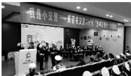
小学生们不仅学习了交通安全知识,还跟着交警学习指挥手势