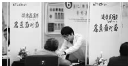
参加义诊活动的市民,赠送民生银行定制的“新春礼遇”一份。

当天现场气氛热烈,近千位市民百姓冒着寒冷,特意赶来参加此次活动。每位参加活动的市民不仅能够获得中医专家的一对一“望闻问切”、现场体质辨识、解读体检报告等服务内容,还能凭义诊处方直接至省中医院缴费取药,七天内免收挂号费。民生银行还为现场参