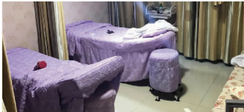
这就是所谓的手术室