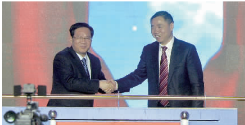
江苏省委书记李强(左)与工信部副部长辛国斌共同启动中国智能制造系统解决方案供应商联盟

造装备发展,促进智能网联汽车、智能工程机械、智能船舶、智能照明电器、服务机器人等研发和产业化,开展远程无人操控等智能服务。构筑工业互联网基础,研发融合IPV6、4G/5G、WIFI技术的工业设备与系统,加大智能制造试点示范推广力度。围绕工业机器人、航空装备、海洋工程装备及高技术船舶、先进轨道交通装备、节能与新能源汽车等重点领域,推进智能化、数字化技术在企业研发设计等环节的深度应用。