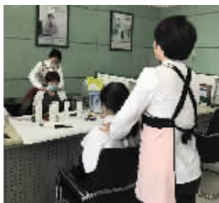
客户在邮储银行体验肩颈护理服务

3月8日,邮储银行为广大女性客户带来了别具特色的“女神节”活动,让每位办理业务的女性客户既能享受到优质的银行金融服务,又能获得免费的肩颈护理、美甲服务,以及养颜保健等增值体验。