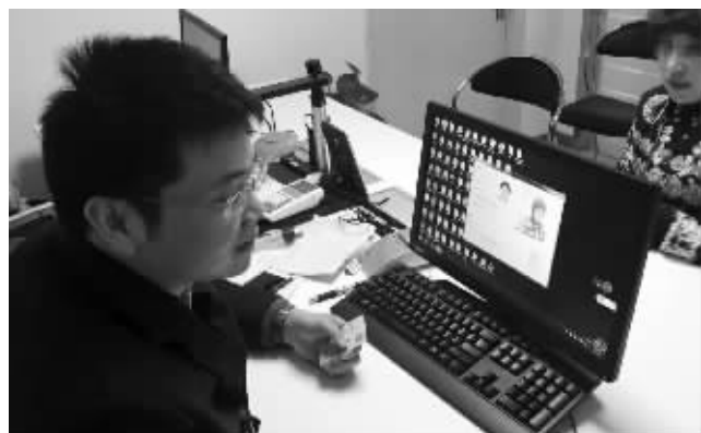
“刷脸”认身份

快报讯(通讯员 薛白 记者 丁晟)随着公证的普及,公证员在日常工作中也遇到了“冒脸顶替”的人。他们拿着真正当事人的身份证,来办理委托书公证或借款合同公证等。为了应对这种情况,雨花台公证处正式启用人脸识别身份认证系统。