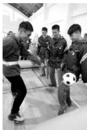
学生们参加嘉年华活动

快报讯(记者 黄艳)2017年南京市“快乐足球·健康成长”校园足球嘉年华启动仪式3月13日在建邺高级中学举行。现代快报记者了解到,由南京市校足办主办的此次活动,将在全市55所校园足球特色中学内相继开展。本次嘉年华活动针对中小学生学习兴趣心理特点,结合智能机器人、VR虚拟现实技术、智能足球等多项创意科技,在专业足球教练的指导下,让每位参与者从跑动、运球、传球、射门中发现足球的魅力。