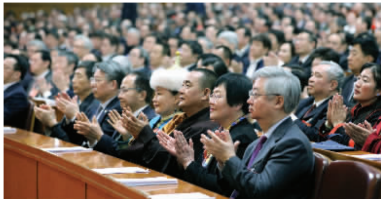
3月13日,全国政协十二届五次会议在北京人民大会堂举行闭幕会

据新华社北京3月13日电 汇聚磅礴力量,共襄复兴伟业。中国人民政治协商会议第十二届全国委员会第五次会议圆满完成各项议程,13日上午在人民大会堂闭幕。会议号召,人民政协各级组织、各参加单位和政协委员,更加紧密地团结在以习近平总书记为核心的中共中央周围,高举中国特色社会主义伟大旗帜,不忘合作初心,继续携手前进,开拓创新、奋发有为,以优异成绩迎接中共十九大胜利召开,为实现“两个一百年”宏伟目标、实现中华民族伟大复兴的中国梦而努力奋斗。 全国政协主席俞正声主持闭幕会。