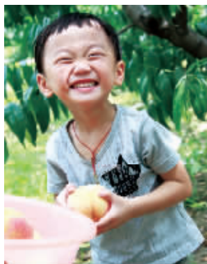
蜜桃成熟,小朋友“桃”醉了