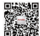
现代快报官方微信