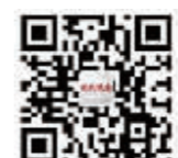
现代快报官方微博