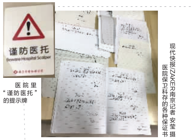
医院里“谨防医托”的提示牌