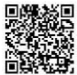
扫码关注 现代快报专题报道

五年,中国再次飞跃。党的十八大以来,五年的时间,中国农村贫困人口减少5000多万。以习近平总书记为核心的党中央高瞻远瞩,把扶贫开发工作提升至治国理政新高度。以高度的政治感、使命感和责任感来解决这一历史难题。确保到2020年,所有贫困地区和贫困人口一道迈入全面小康社会。贫困是全球性难题,发达国家也难以消弭本国内的贫困鸿沟。中国用五年成就了一个“世界奇迹”,并将更进一步攻坚克难,做好精准扶贫。近期,全国130名记者,深入22个省份110个贫困村,与当地村民同吃同住同劳动,驻村调研长达一个月。他们发回的报道,都带有泥土的芳香,是三年来脱贫攻坚最真实、最鲜活的样本。