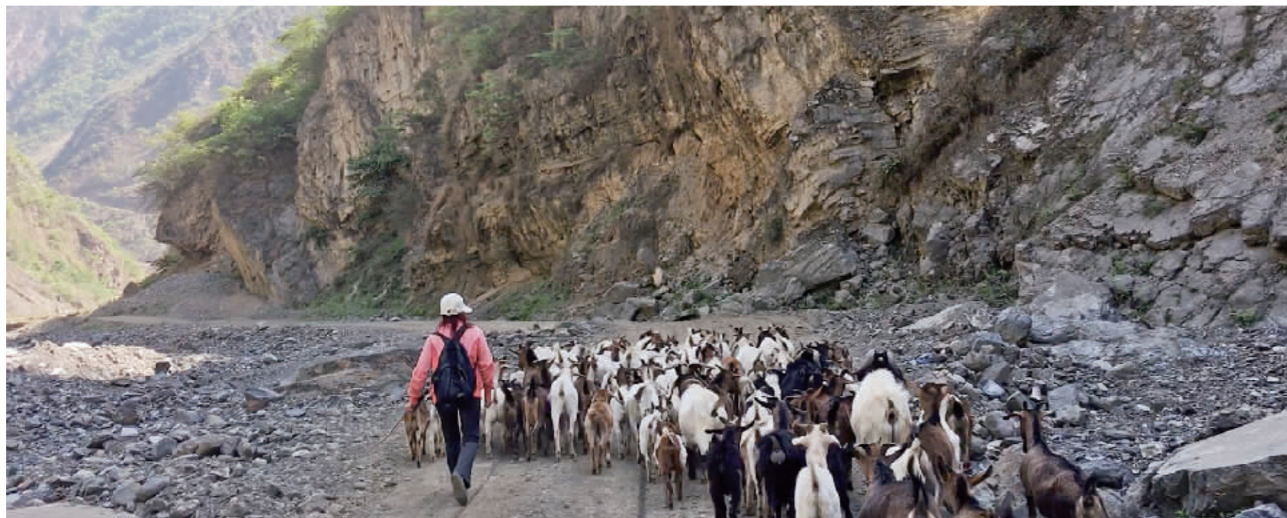
四川绵阳平武县南坝镇洪溪村,在进村的山路上,有村民赶羊经过,这是一条河道里面的路,每年6、7、8月份雨季来了就会涨水走不了