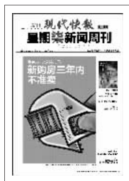
上期星期柒新闻周刊封面