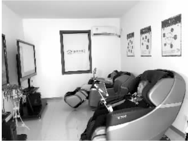
小区里新建的居家养老服务社