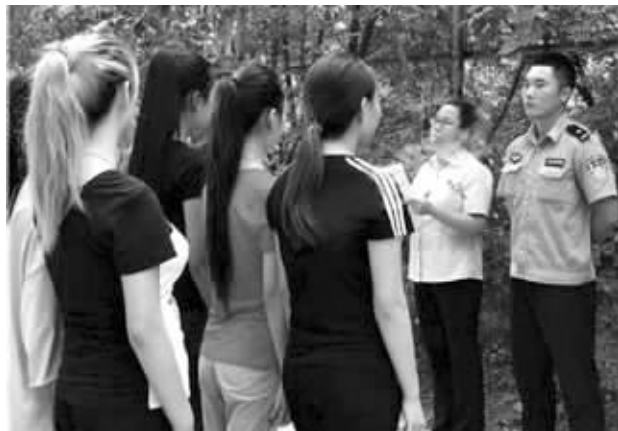
校园“小霸王”们在北京通州某生态农场参与军事训练