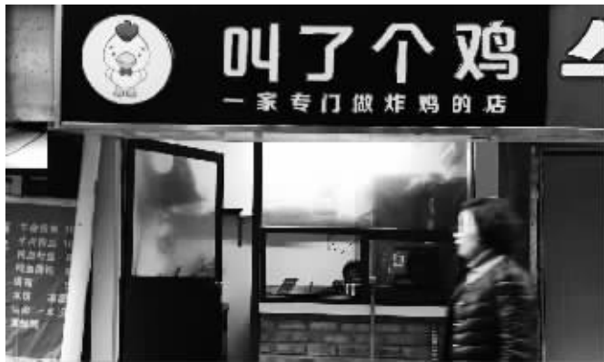
南京一家“叫了个鸡”的门店正在营业