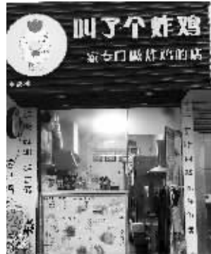
南京新街口附近的一家门店已改名“叫了个炸鸡”

对于目前还存在的不良文化的广告,南京市工商部门表示,一旦发现,一定会采取相关措施予以查处并制止。