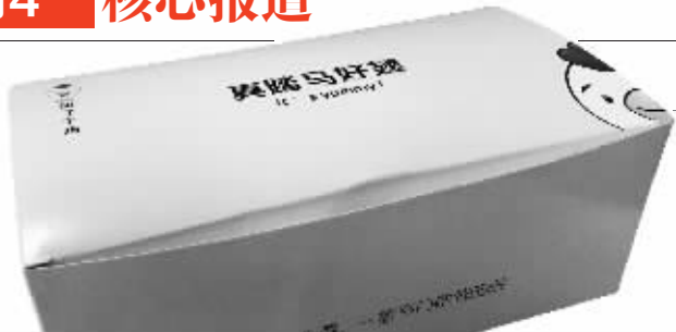
包装盒上仍有不良宣传用语

如果你是炸鸡爱好者,估计吃过“叫了个鸡”。这个名字奇怪的炸鸡店,在南京有不少家,吸引了很多消费者。不过,近日这家店被曝出因为宣传用语违背社会良好风尚,被罚款50万元。11月1日,现代快报记者探访南京的加盟店,发现仍有“叫了个鸡”“真踏马好翅”等宣传语。