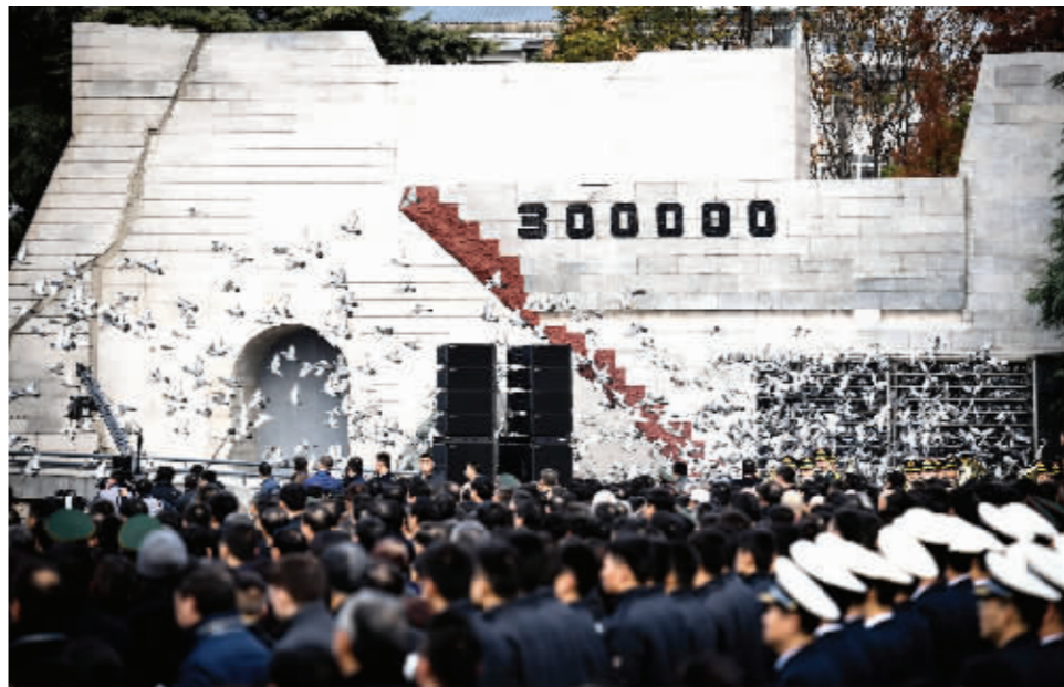
南京大屠杀死难者国家公祭仪式现场放飞和平鸽