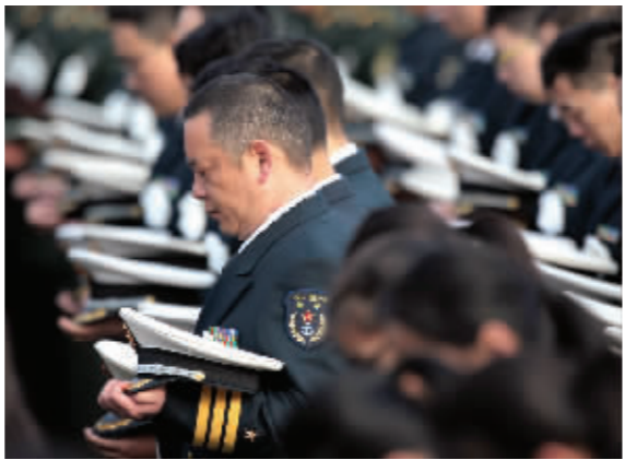
向南京大屠杀死难者默哀