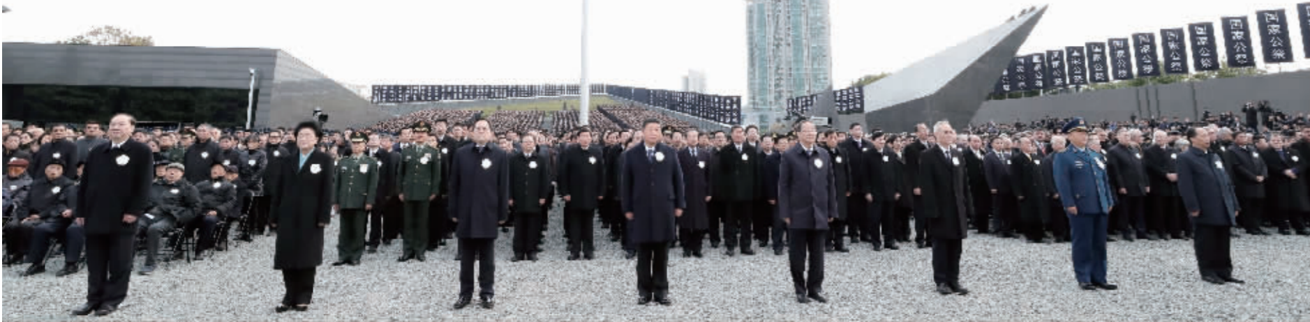
习近平、俞正声等党和国家领导人出席仪式