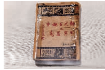
《外人目睹中之日军暴行》