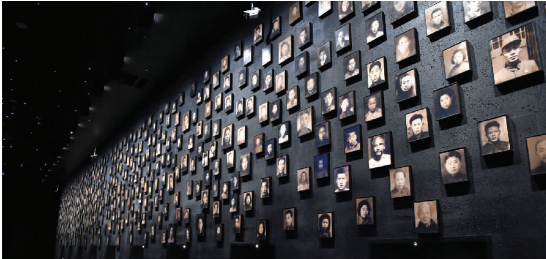
南京大屠杀幸存者照片墙