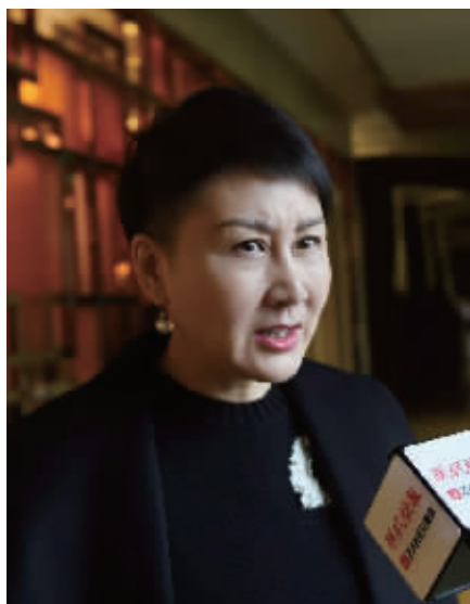
全国政协委员张凯丽