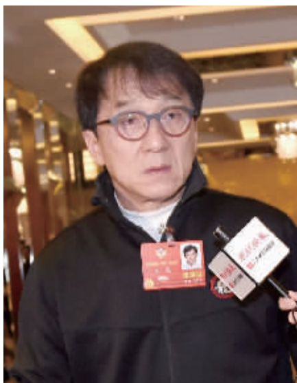
全国政协委员成龙