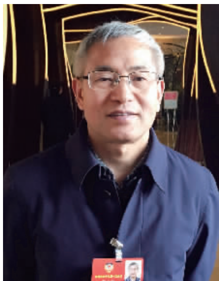
全国政协委员贺云翱