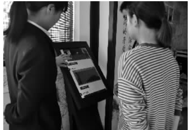
游客在“旅游管家”前查询线路 通讯员供图